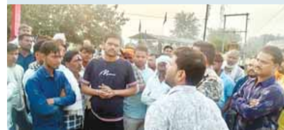
पुलिस बल तैनात, भीम आर्मी और हिंदू संगठन आमने-सामने

बड़ा मलहरा। जिले के घुवारा क्षेत्र के ग्राम बमनोरा कला में मंगलवार देर शाम बाबा साहेब डॉ. भीमराव आंबेडकर की प्रतिमा स्थापित किए जाने को लेकर बड़ा विवाद खड़ा हो गया। बताया जा रहा है कि मंदिर परिसर की भूमि पर रातों-रात प्रतिमा स्थापित की गई, जिसके बाद भीम आर्मी और हिंदू संगठनों के कार्यकर्ता आमने-सामने आ गए।