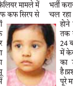
अंबिका को 14 सितंबर को गंभीर हालत में

बच्चों की मौत का सिलसिला थमने का नाम नहीं ले रहा है। आरोपी डॉक्टर और कंपनी मालिक के अलावा कुछ अन्य दुकानदार, स्टॉकिस्ट और एक महिला एनालिस्ट पर कार्यवाही की गई है। गैर इरादतन हत्या के आरोप में एफआईआर हुई है। जांच के बाद और आरोपी सामने आ सकते हैं। बुधवार को एसआईटी ने श्रीसन फार्मास्युटिकल कंपनी की 61 वर्षीय कैमिकल एनालिस्टिस को